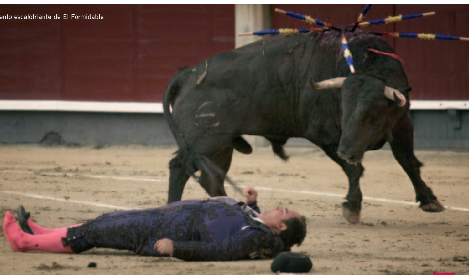
Momento escalofriante de El Formidable

“Mauricio Berho no es un fotógrafo taurino al uso, es mucho más. Un artista con una sensibilidad especial que sabe plasmar lo mejor de cada torero, su concepto y su personalidad. Tiene una amplia visión de lo que es el arte de torear y siempre ve más allá de lo que vemos los demás. Es una artista, un bohemio y un romántico”.