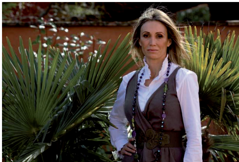
Cristina Sánchez, fotografía perteneciente a la exposición sobre la mujer en el mundo del toro.