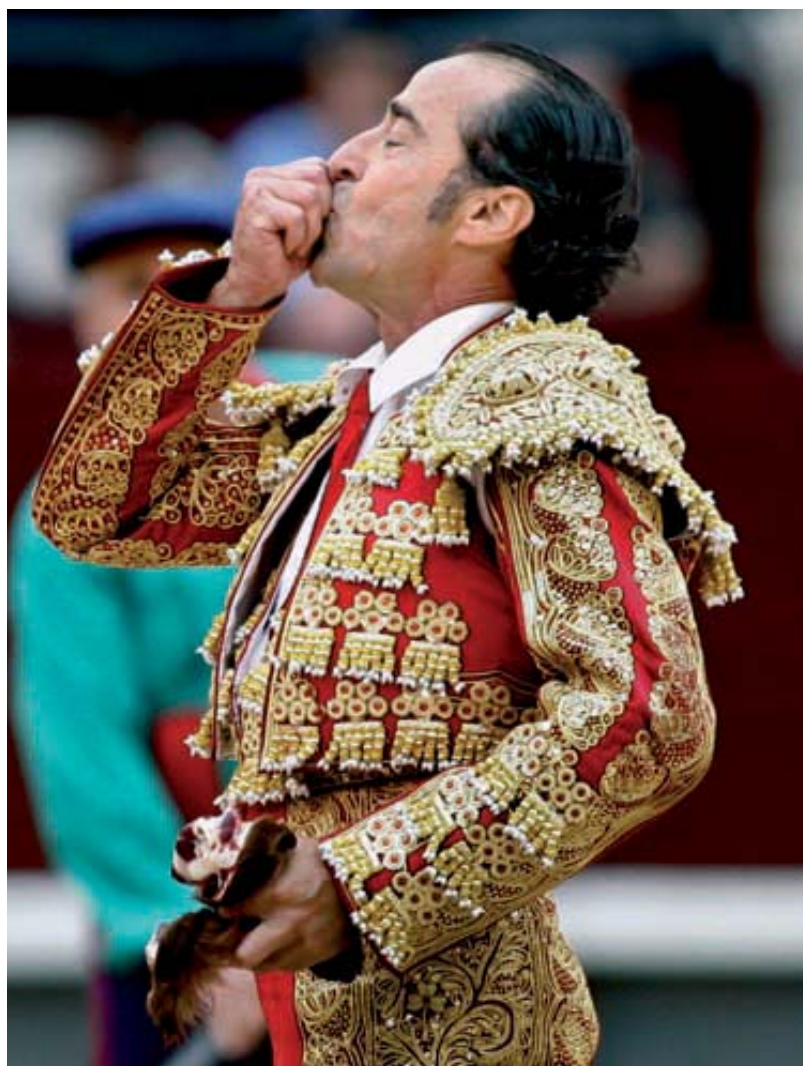
Fotografía ganadora del concurso Taurodelta 2009. Autor: Ignacio Gil.

El premio a la mejor fotografía fue para Ignacio Gil por su trabajo titulado Beso esta arena , publicado en el diario ABC el día 5 de junio, por su calidad periodística y simbólica de uno de los momentos más memorables de las mencionadas ferias. Ignacio Gil consigue su segundo premio Taurodelta, que ya ganara el pasado año ex aequo con Alfredo Arévalo.