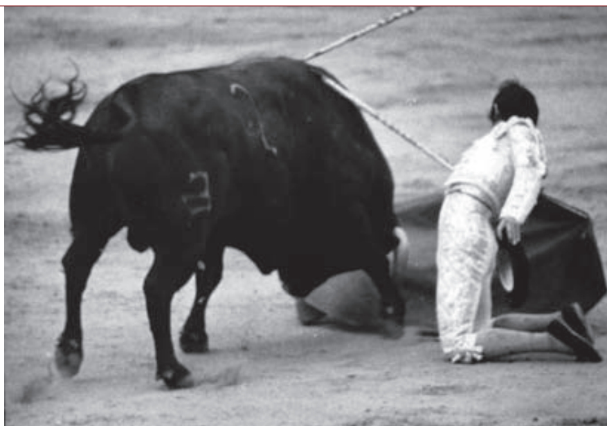
Extraordinario pase de rodillas con la derecha de Palomo Linares al toro Cigarrón , del que cortó las orejas y el rabo en la feria de San Isidro de 1972.

Como todas las ganaderías punteras, y más siendo predilectas de las figuras, la de Atanasio sufrió una sistemática