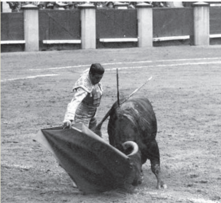
Un muletazo de Antonio Ordóñez al toro Bilbalarga en la histórica faena del 17 de mayo de 1960.

Nuevamente hubo doblete en 1965: una corrida en San Isidro y otra en la Beneficencia. Aunque no se superó el listón del año anterior, hubo varios ejemplares destacados por su bondad y templanza: Zagalito , Langostino y Malagón ; a los dos últimos les cortaron una oreja El Cordobés y El Viti, respectivamente. Durante todas las ferias de San Isidro hasta el final de la década se lidiaron en Madrid