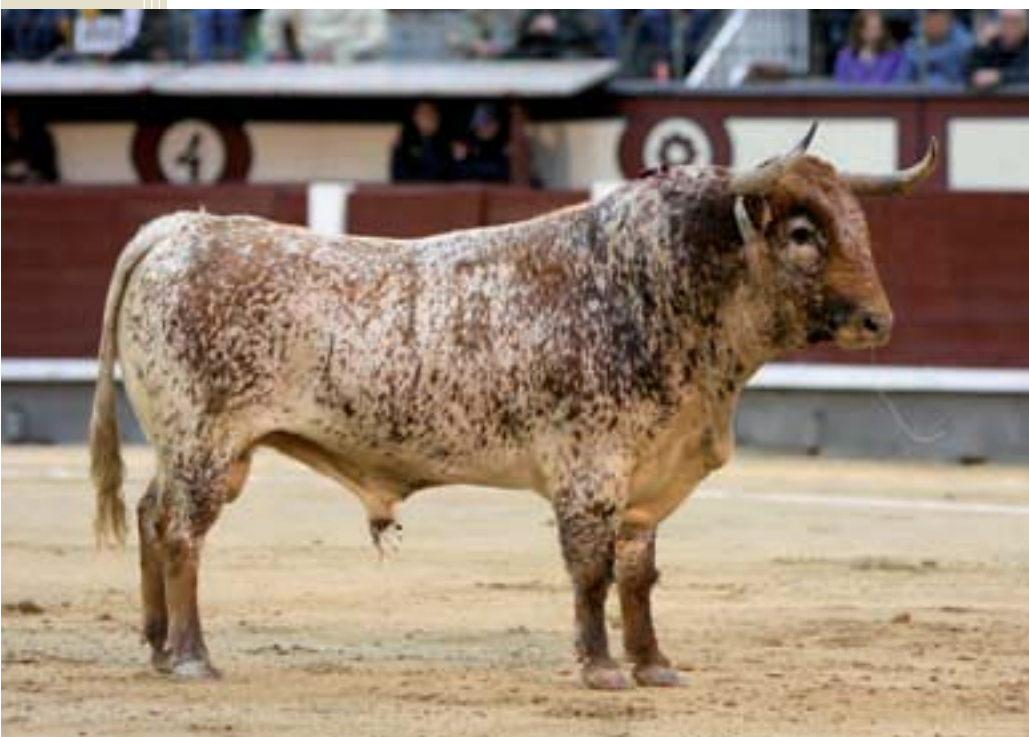
Lentisco, lidiado el 10 de junio de 2008

Los selecciono, como hago con todas las corridas, por similitud en su trapío.