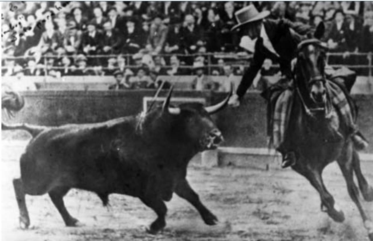
Antonio Cañero, iniciador del toreo a caballo

llos. En su primera etapa, S. XII-XV, no existían normas técnicas, organizativas, ni tampoco Reglamento alguno que regulara el desarrollo de la lidia. Sin embargo, a partir del S. XV los caballeros entienden que los enfrentamientos con los toros deben ser menos violentos y más templados. Bajo esta consideración surge la suerte de la lanzada, atribuida a Pedro Ponce de León quien, según Fernán Chacón, la practicaba de la siguiente manera: "El caballero se colocaba en la plaza con su caballo con los ojos tapados y esperaba al toro. Cuando el astado se arrancaba hacia el caballo, Ponce de León ponía la lanza sobre el 'morrillo', desviaba al caballo con su mano izquierda y clavaba la cuchilla".